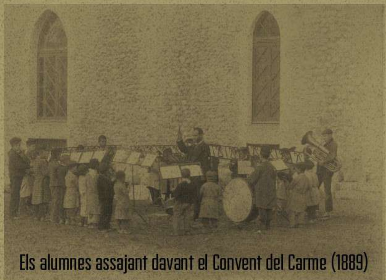
Els alumnes assajant davant el Convent del Carme (1889)