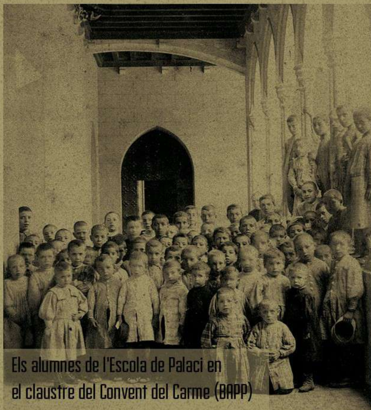
Els alumnes de l'Escola de Palaci en el claustre del Convent del Carme (BAPP)