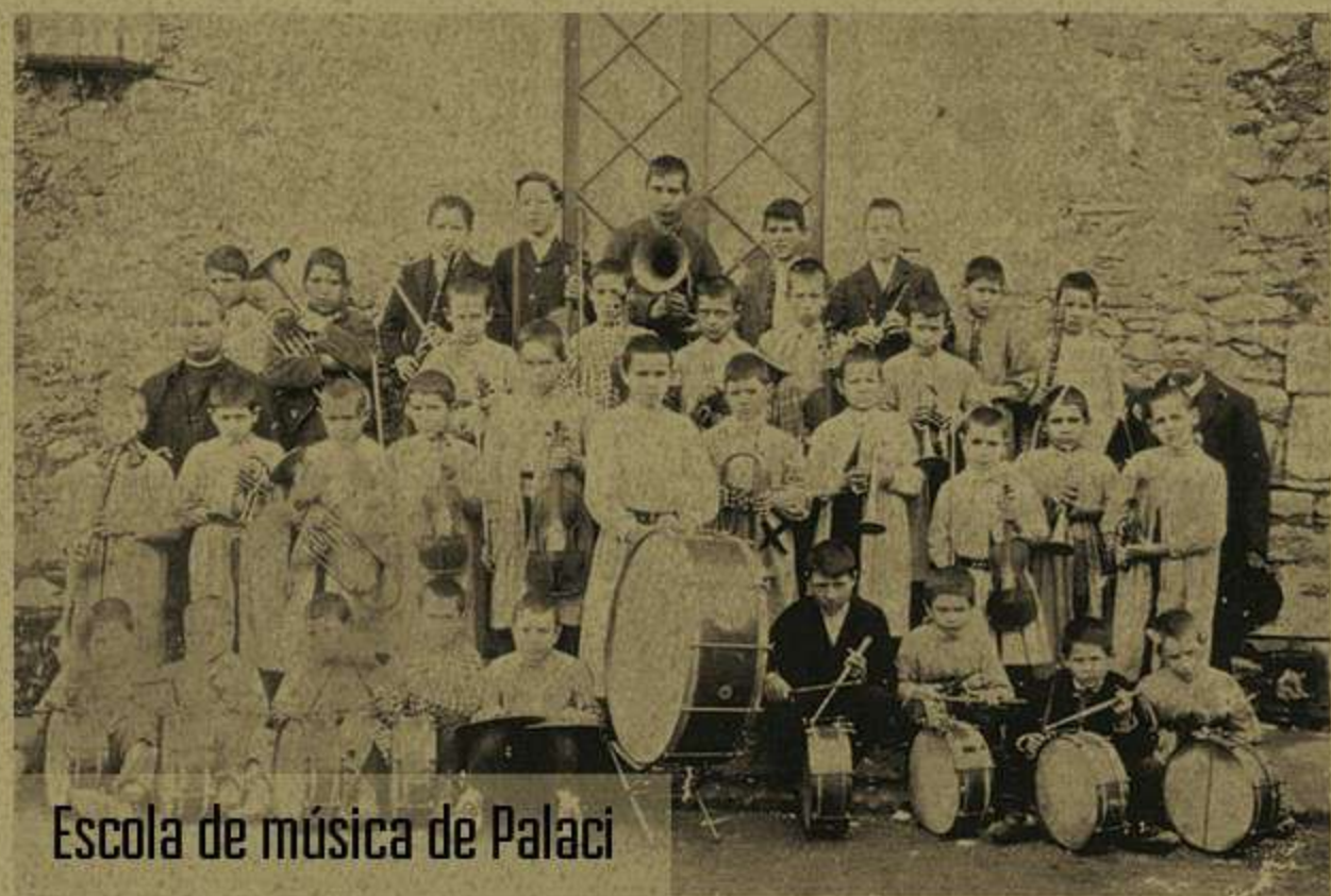
Escola de música de Palaci