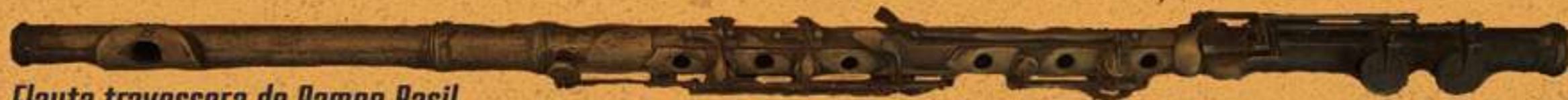
Flauta travessera de Ramon Basil

Des del punt de vista professional es trobava vinculat a la notaria de Salvador Dalí Cusi (1872-1950), en la qual amb els anys va arribar a primer passant; però serà per les activitats musicals complementàries per les que passarà a formar part de la microhistòria figuerenca i empordanesa.